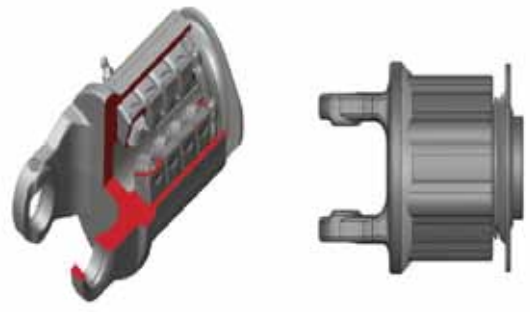
- Dispositivo limitatore di coppia a nottolini Radial pin clutch